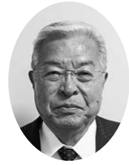
加賀市社会福祉協議会会長