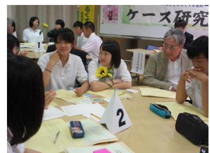
社明：公開ケース研究会