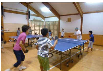
ふれあい卓球(作見)

手芸クラブ、クッキング、工作遊び、七夕行事、夏まつり、お勉強会、赤いリンゴお届け事業、クリスマス行事、もちつき大会、旗源平、節分行事、新学年お祝い会、ボランティア活動等