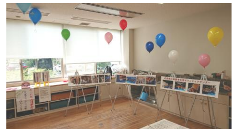
災害VC：防災フェスタ（あいりす）