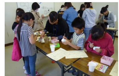
加賀市子どもまつり