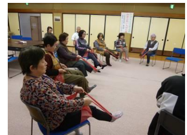
みき元気いちばん塾 (軽体操)