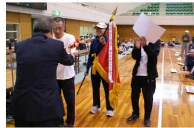
優勝チーム(作見地区)