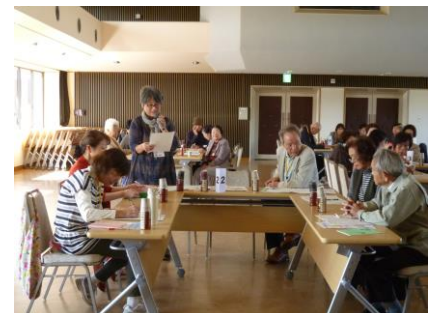
ボラ連：鯖江市との交流会