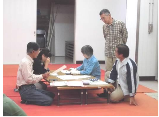
橋立地区（要支援者の確認）