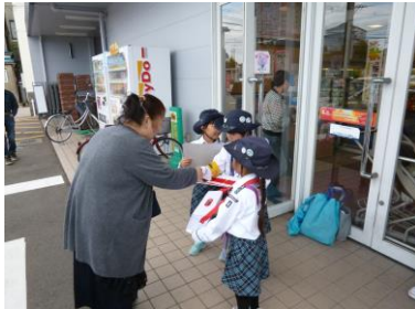
マルエー大聖寺店

(3) 街頭募金の実施 実施数 7回 協力団体 18団体 募金額 86,484円