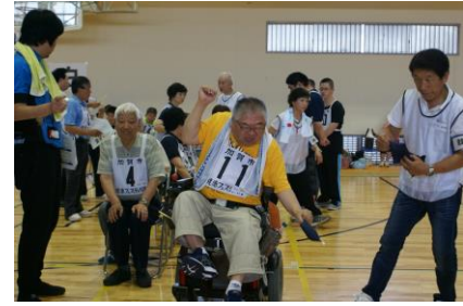
障がい者スポーツ大会