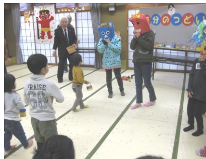
せつぶんのつどい (大聖寺)