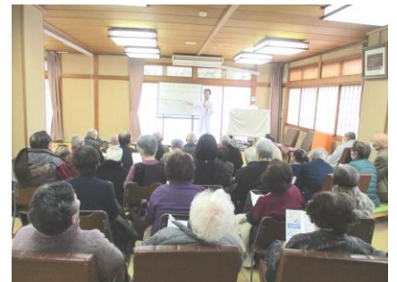
高齢者健康講座 (片山津)