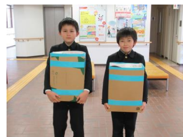
プルタブ寄附 (緑丘小学校)