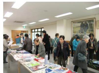
歳末たすけあいバザー