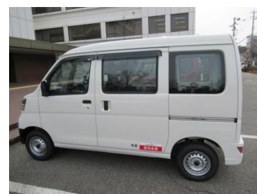
石川県信用金庫協会寄贈車両