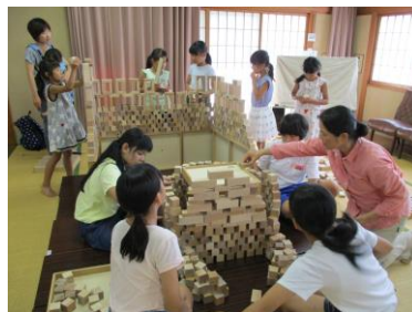
積み木ワークショップ(片山津)