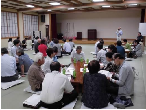
大聖寺地区（要支援者の確認）