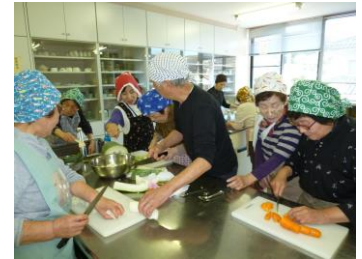
生きがいデイ (調理実習)