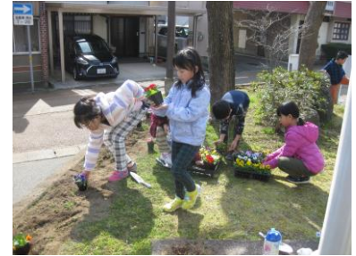
お花を植えよう（大聖寺）