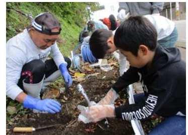
町の花壇に球根を植えよう