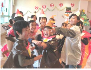
クリスマス会（山代）