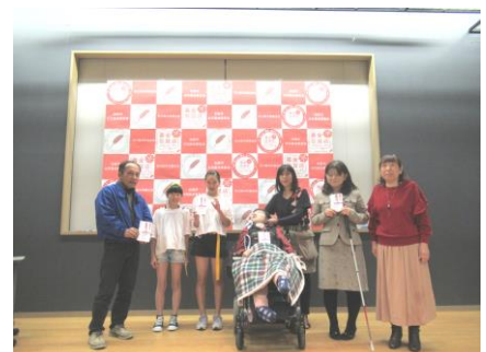
ワンコイン発表者