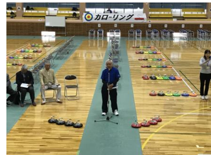
身障協会：カローリング