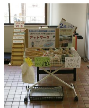
山中総合福祉センター