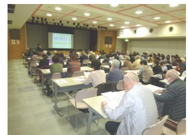
おたっしやサークル連絡会