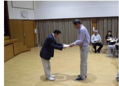
委嘱状交付（動橋地区）