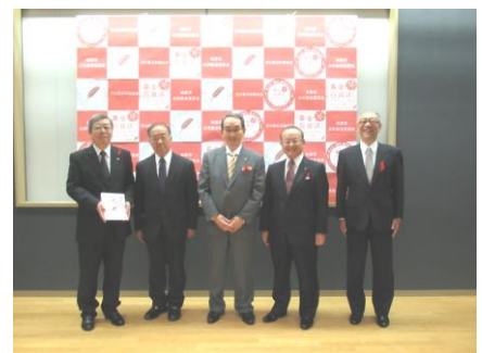
募金百貨店プロジェクト寄付金贈呈