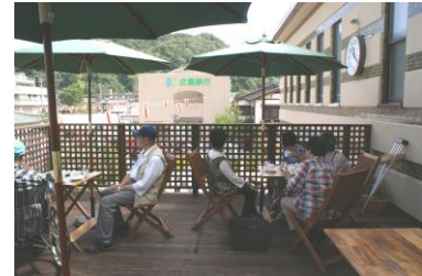
テラス席でまつり見学