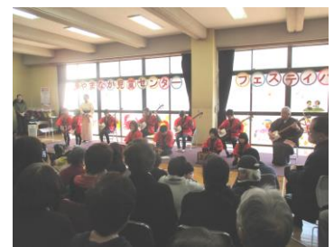
フェスティバル(山中)