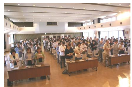
民生委員児童委員の集い