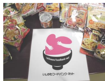
メーカーで集まった品