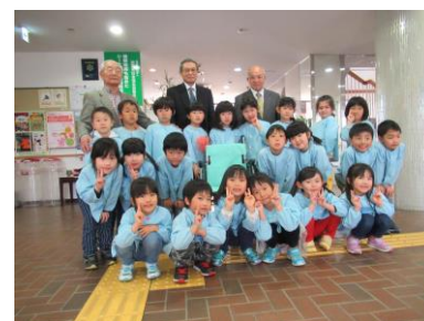
車イス贈呈式 (動橋保育園)