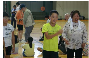
ふれフレマッチ (ペタンク)