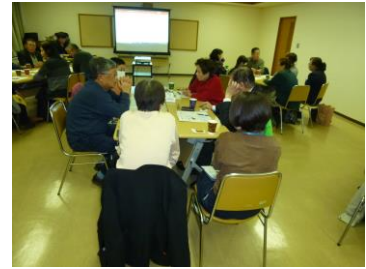
フォローアップ研修