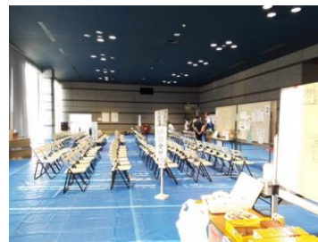
広島県江田島市被災者生活サポートボランティアセンター