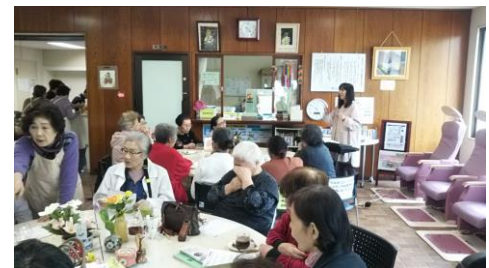
しゃくなげサロン