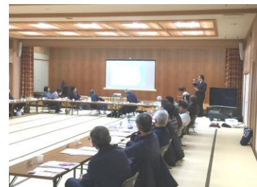
PR研修(山代地区民児協)