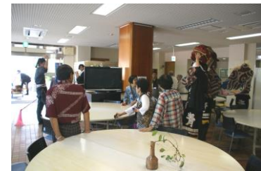
山中青年団による獅子舞