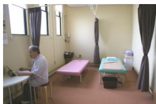
マッサージにこっと