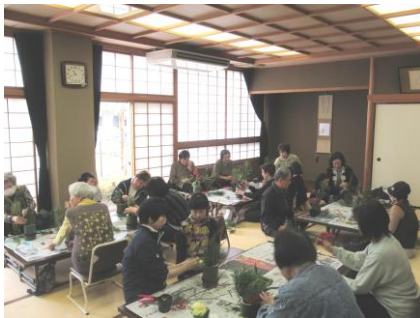
ミニ門松づくり (山代)