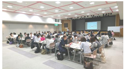
介護サービス事協：軒下研修会