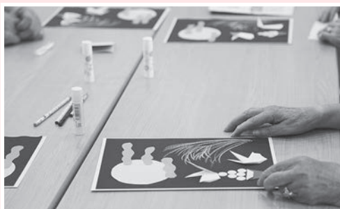
8月には、「中秋の名月」の作品を折り紙で作りました。

『ボランティア連絡会』の行事が11月25日(土)13時30分に開催されます。今回は、民謡や津軽三味線、紙芝居などの楽しい催しを予定しています。今後、ホームページやボランティアだよりで詳細を発信していきますので、関心のある方はご参加ください！