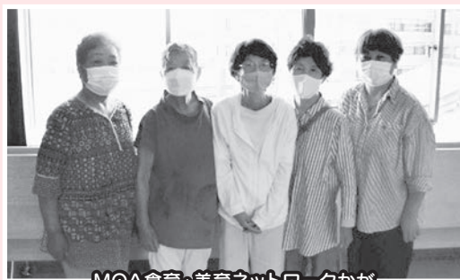
MOA食育・美育ネットワークかが

これからも「美より情操を育んでいただき、豊かな心へとつなぐ」を目指しボランティア活動に励んでいきます。