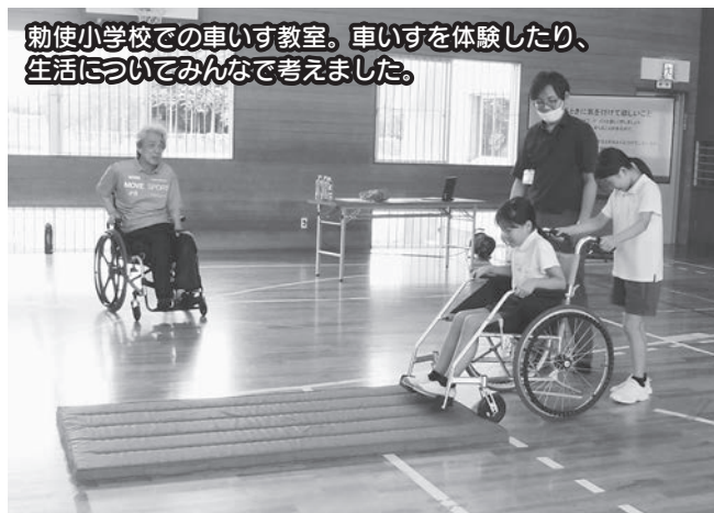
勅使小学校での車いす教室。車いすを体験したり、 生活についてみんなで考えました。