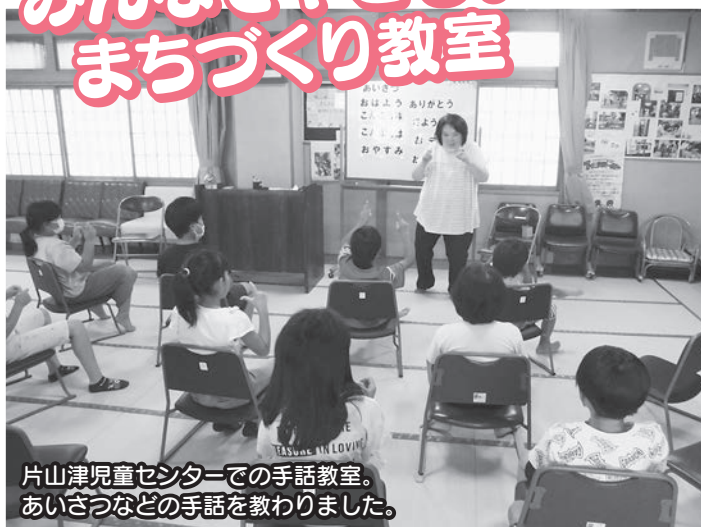
片山津児童センターでの手話教室。 あいさつなどの手話を教わりました。