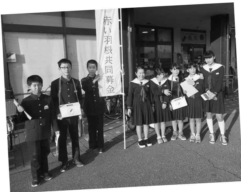
▲マルエー動橋店 (動橋小学校企画委員)