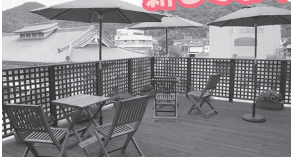
◀ゆざや喫茶 テラス席

今年5月、大規模な改修を終え、山中老人福祉センターが生まれ変わりました。2階には、就労継続支援B型「アットワーク」を新たに開設。様々な方にご利用頂き、賑わいのあるセンターになる事を願っています。