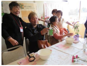
ボランティア体験