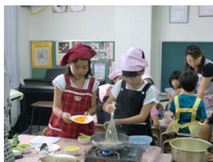
キッズクッキング（片山津）