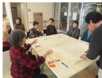
福祉協力員研修会