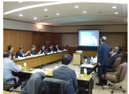
市議会教育民生委員会意見交換会