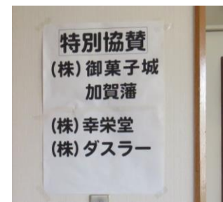
ボランティアの集い