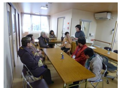
生活支援サポーター養成講座 (施設見学)