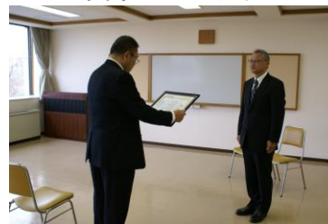
ライフプラン協会