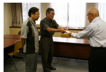
加賀市アートクラブ