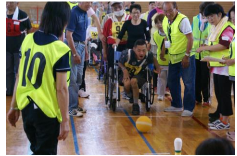
障がい者スポーツ大会

協賛企業 一般社団法人 加賀建設業協会 株式会社 御菓子城加賀藩 株式会社 加賀福祉サービス 株式会社 ダスラー 佐々木プリント株式会社 社会福祉法人 南陽園 セブン-イレブン 加賀市役所前店 竹内製菓株式会社 トータルオフィス織田