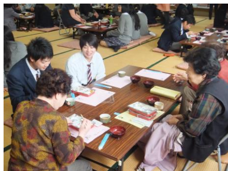
孫ころ弁当(片山津町)