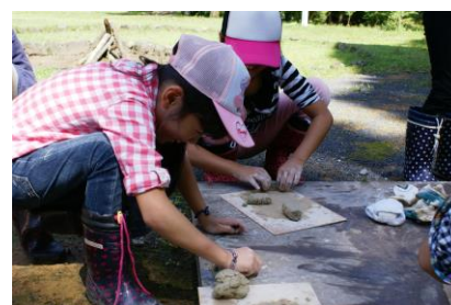
合同行事：陶芸体験（県民の森）