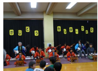
センターフェスティバル （やまなかっ子ボランティア）