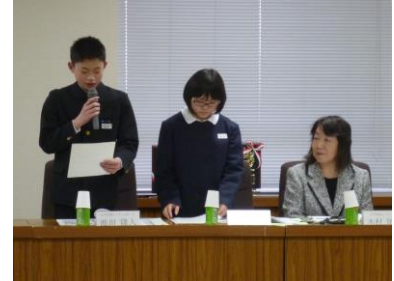
健民運動青少年ボランティア賞 (やまなかつ子ボランティア)