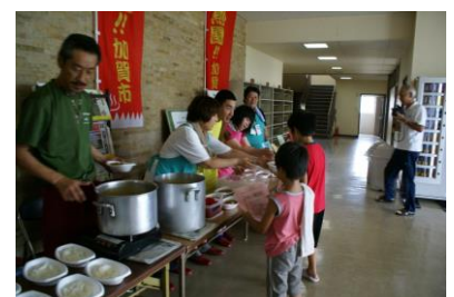
児童センターと体の不自由な人との交流会