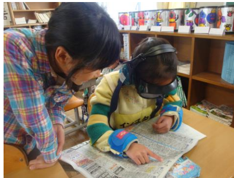
分校小学校 「高齢者疑似体験活動」