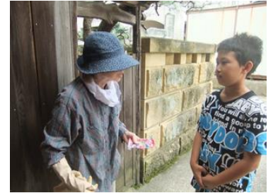
敬老の日クッキープレゼント （山代っこボランティア）