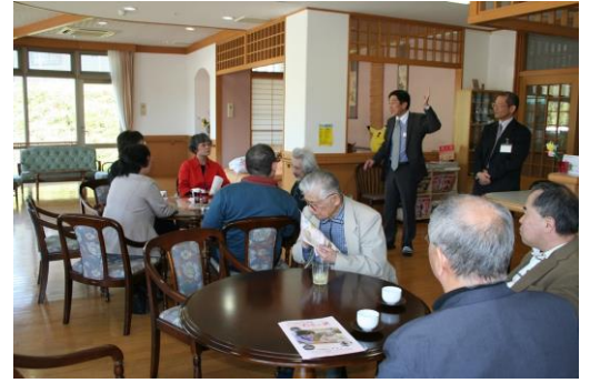
福祉避難所見学会(サンライフたきの里)