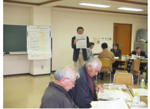
専門委員会合同会議（1月26日）