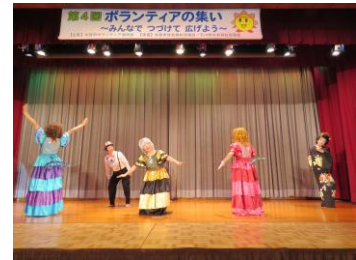
ボランティア活動発表