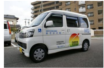
ダイハツアトレイ