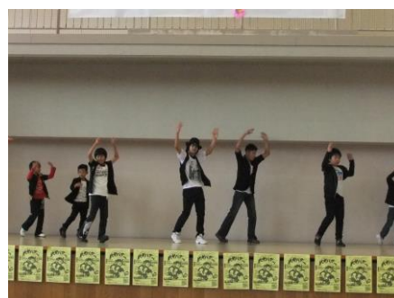
ピップホップダンス（山代）