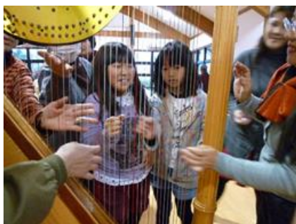
クリスマス ハーブと詩のコンサート（作見）

自然と遊ぼう！ 2014、陶芸体験、遊びのチャンピオン大会、旗源平、手芸クラブ、映画会、キッズクッキング、工作遊び、七夕行事、クリスマス行事、お正月行事、もちつき会、節分行事、ボランティア活動等