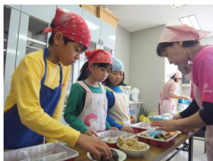
動橋地区食事会(児童センター児童参加)

市内5地区(動橋・片山津・湖北・金明・塩屋)で高齢者を対象に食事会および配食サービスが開催され、地区社会福祉協議会へ助成した。