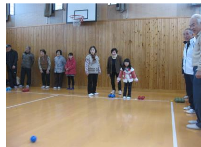
みんなで“ペタンク”を楽しもう! (大聖寺)