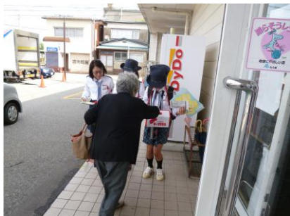
ガールスカウトジュニア部門