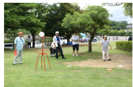
身障協会：バリアフリーディスク ゴルフ競技大会