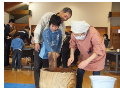
もちつき会 （さくみっ子ボランティア）