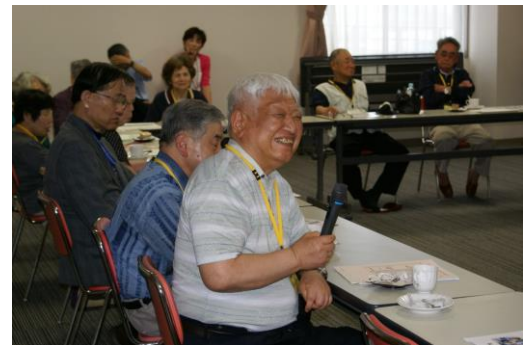
福祉避難所見学会(南陽園)