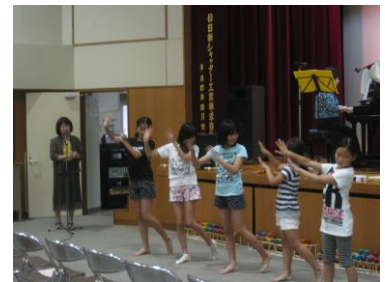
サマーコンサート （動橋っ子ボランティア）