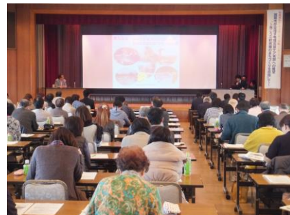
介護予防・日常生活支援総合事業生活 支援サービス構築業務最終報告会