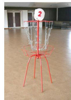
バリアフリーディスク