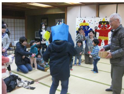
せつぶんのつどい（大聖寺）