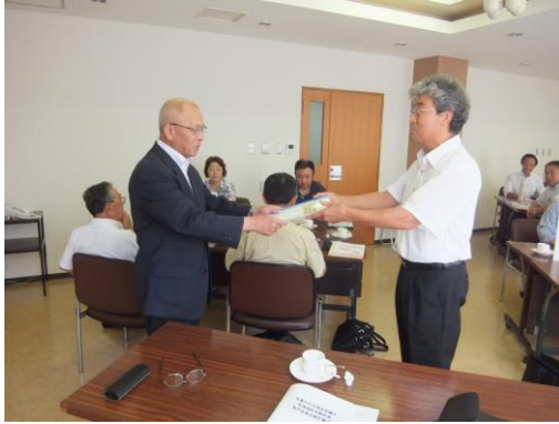
専門委員会合同会議（報告書を答申）

・ 平成25年度提出された課題について、具体的な取り組みを各委員会ごとに集まり協議した。