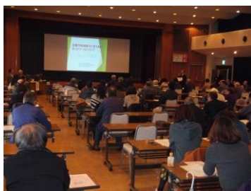
地域見守り支えあい ネットワーク担当者研修会