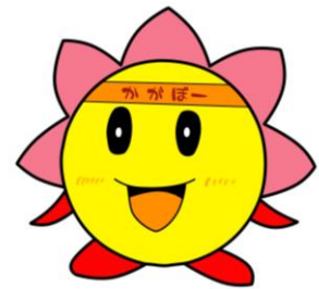
ボランティアキャラクター かがぼー