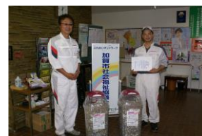
ホンダカーズ加賀