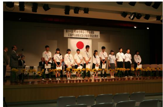
社明：中学生一日保護司