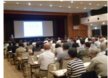
民生委員児童委員の集い