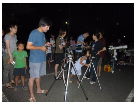
親子星空観察会（山中）