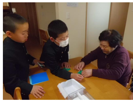
片山津小学校 「福祉施設訪問」